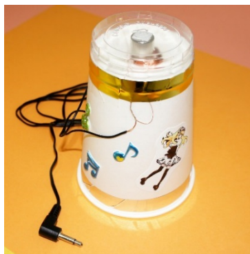
紙コップスピーカー