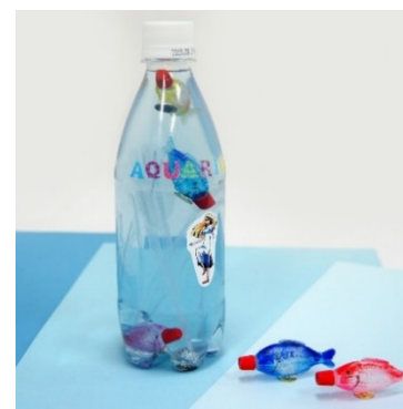
うきうきフィッシュ