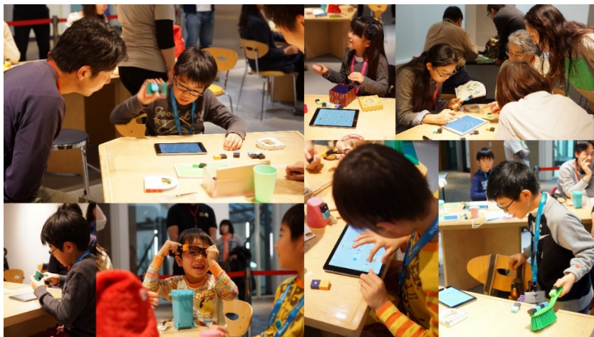
これまでに開催した MESH ワークショップの様子

MESH タグは、それぞれ動きセンサー/ライト/ボタン/明るさセンサーなどのさまざまな機能を持ち、無線で MESH アプリとつながることができます。MESH アプリ上でこれらのタグを連携させ、自分で考えたアイデアがかんたんに実現できます。