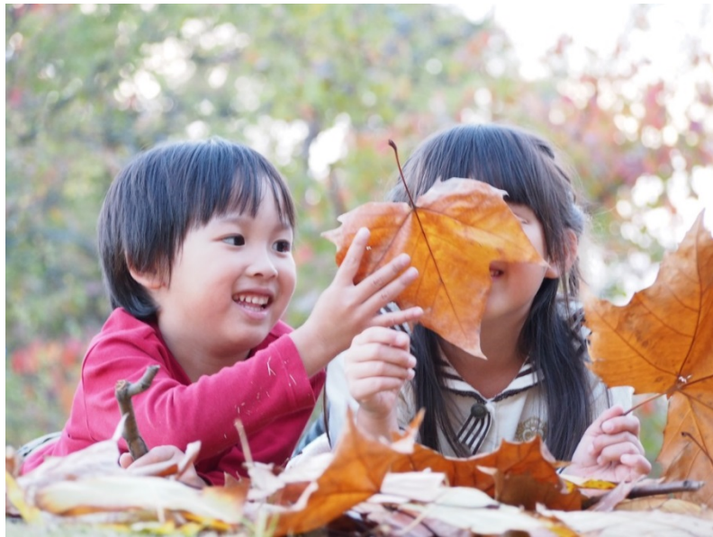
【科学する心賞】入選作品 『どんなにおい?』 アルバカ(兵庫県)