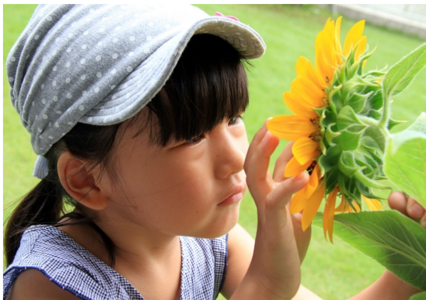
【科学する心賞】入選作品 『ヒマワリの観察』 makaho(和歌山県)