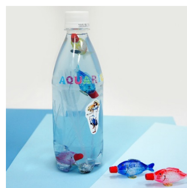
うきうきフィッシュ