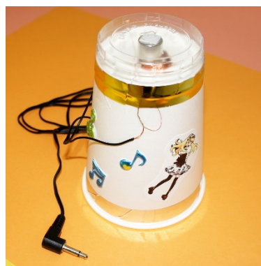
紙コップスピーカー