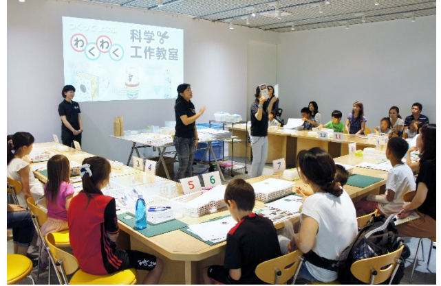
<「わくわく科学工作教室 第1弾 光編」の様子>