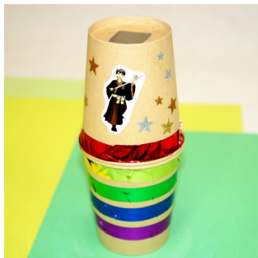
虹色きらきらスコープ