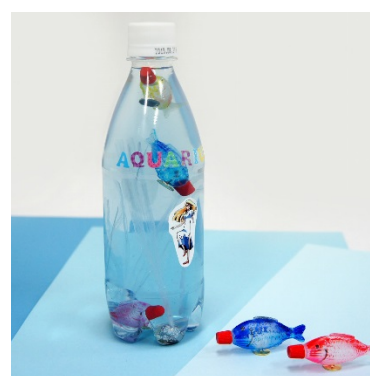
うきうきフィッシュ