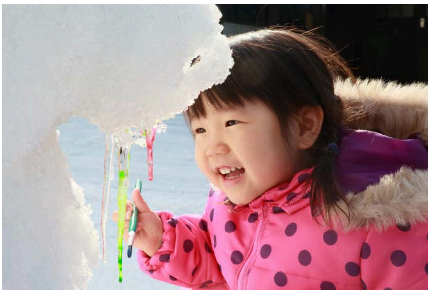
【科学する心賞】入選作品 『かわいい「つらら」』 つなぐユメ(北海道)