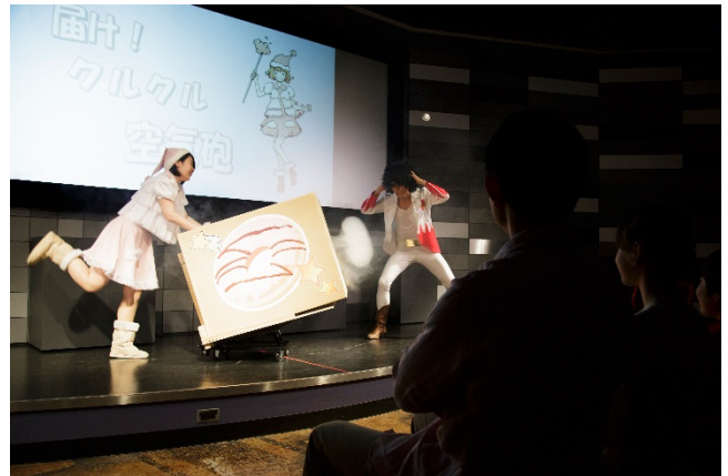
<実験ショーの様子>