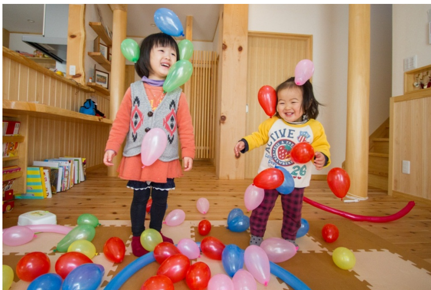
【科学する心賞】入選作品 『風船が体にくっついた!!』 セブンセブン(岡山県)