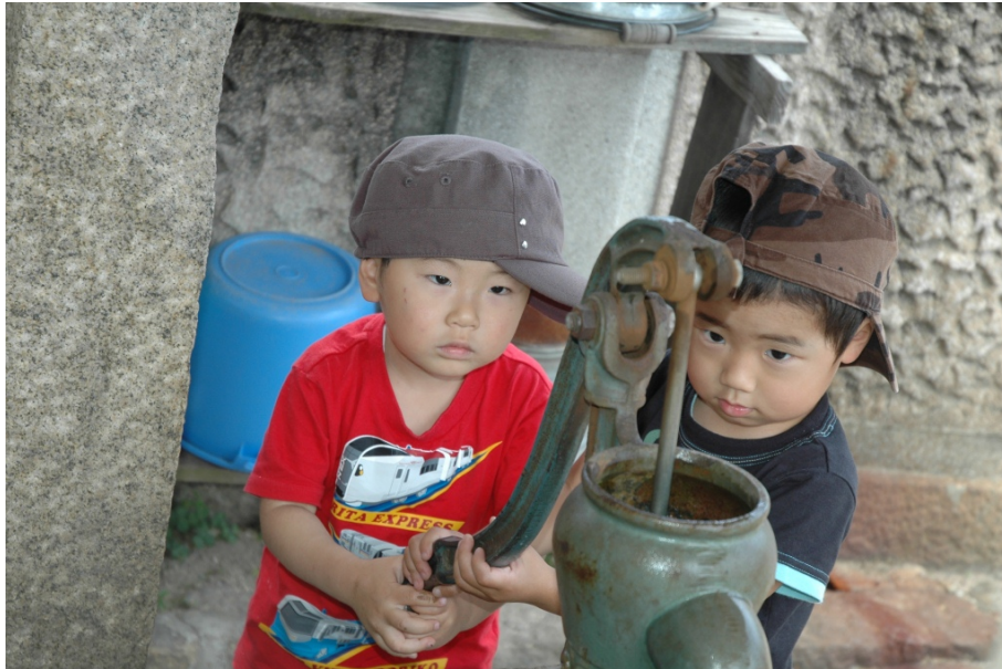
【科学する心賞】入選作品 『どうして水が出るのかな』 MAC（広島県）