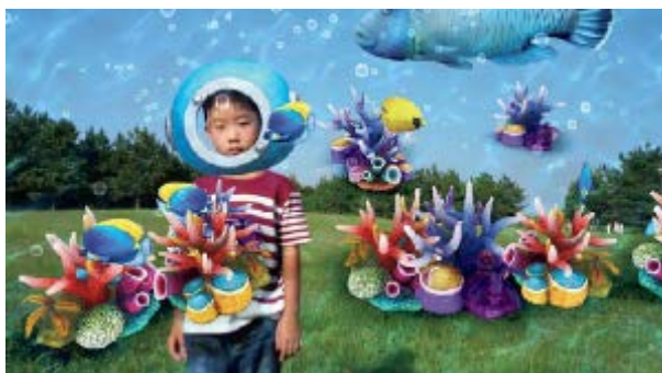
※「AR エフェクト」を使った画像の例