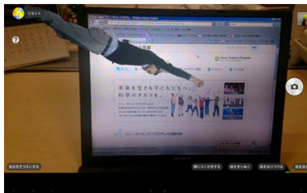
※「AR ワークショップ」用のアプリを使った画像の例