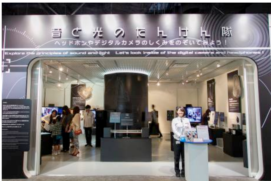
企画展 『音と光のたんけん隊 ～ヘッドホンやデジタルカメラのしくみをのぞいてみよう!～』 外観