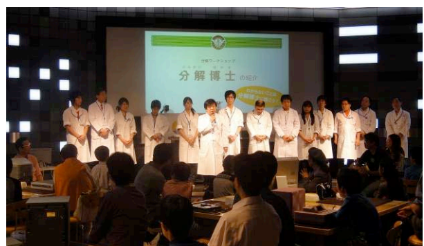
※過去開催の「分解ワークショップ」の様子