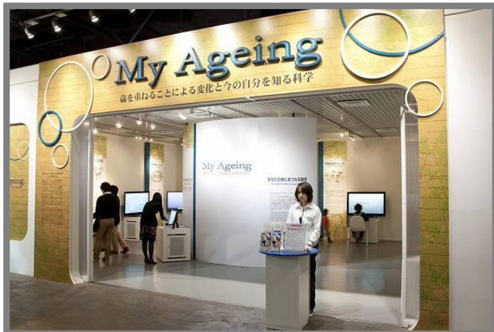
企画展『My Ageing ～歳を重ねることによる変化と今の自分を知る科学～』外観