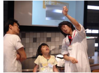
「分解ワークショップ」(過去の様子)