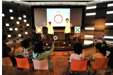
「サイエンス〇×サバイバルクイズ」